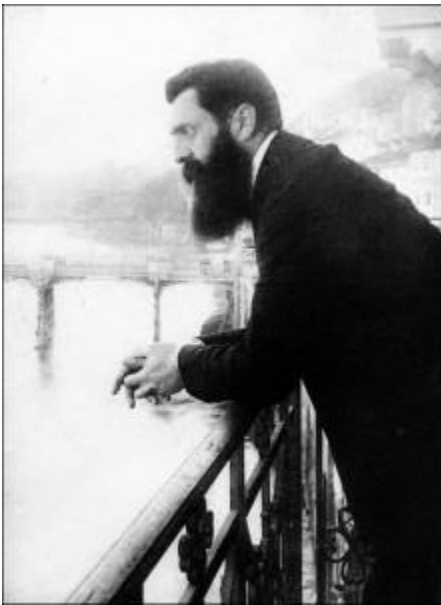
Theodor Herzi – Idejni tvorac današnje države Izrael

S druge strane, Jevreji Sefardi su potomci prognanika iz Španije i Portugala, te se kao grupacija razlikuju se od Aškenazi Jevreja. Termin Sefardi prvo se vezivao za Malu Aziju, ali je u srednjem veku doveden u vezu sa Španijom jer su tu doživeli svoje zlatno doba . Pored toga što danas uglavnom označava Jevreje s Iberijskog poluostrva, on generalno podrazumeva Jevreje islamskog sveta. Na hebrejskom reč Sefard (Sfarad, סְפָרַד) znači španski. Kao i njihovi sunarodnici iz severne i istočne Evrope, i Sefardi su razvili svoj poseban jezik kojim su se na području Iberijskog poluostrva sporazumevali. To je judeo-španski, odnosno Ladino (לאדינו) jezik. Kao i Jidiš, Ladino za osnovu ima hebrejski, ali se razvijao pod velikim uticajem Islama, odnosno Arapskog i Turskog jezika, koji i čine dobar deo fonda reči Ladina. Takođe su delimičan uticaj izvršili Francuski, Bugarski i Grčki, ali i slovenski jezici. Sve u zavisnosti od geografskog porekla samih Sefarda koji su njime pričali. Piše se standardnim latiničnim fontom, za razliku od Jidiša.