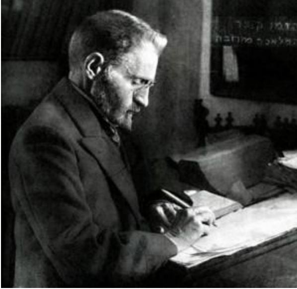
Eliezer Ben Jehuda – Tvorac modernog hebrejskog

ljudi u delovima Sirije, Libana i Izraela. Na granici je odumiranja. Aramejski je jako srodan sa hebrejskim jezikom.