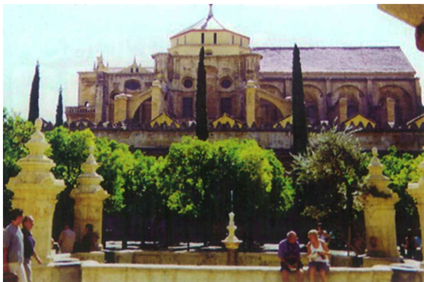
Ješiva (akademija) u Kordobi čiji su utemeljivači Moše ben Hanoh, emisar iz Vavilona i Hazdai Ibn Šaprut, diplomata arapskog kalifa Abd al Rahmana III.

Tokom tih godina Španija je postala jedan od glavnih centara za izučavanje Tore u svetu. Pomogao je i obnovu učenja hebrejskog jezika i poezije među španskim Jevrejima. To je omogućio kupovinom brojnih knjiga na hebrejskom jeziku i time je dao podršku jevrejskim učenicima, sledbenicima i pristalicama koji su pohađali akademiju, a koji su željeli edukaciju na hebrejskom jeziku.